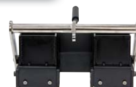
4 in x 4 in x 4 in SmartDie II

Szeroki wybór aplikatorów umożliwia nakładanie linii ciągłej (5–30 cm), przerywanej lub podwójnej za pomocą specjalnej matrycy. Korzystając z szablonu, można malować napisy, znaki „stop” i znaki ostrzegawcze.