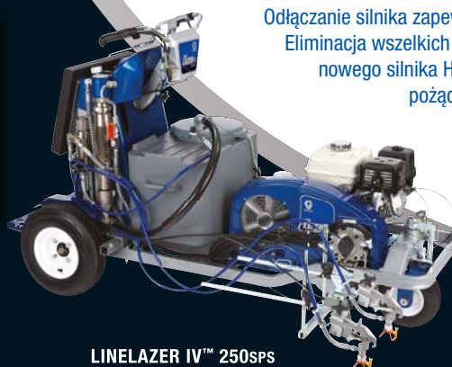
LINELAZER IV™ 250SPS

Odłączanie silnika zapewnia szybkie uruchamianie. Eliminacja wszelkich obciążeń podczas rozruchu nowego silnika Honda® GX 270 - najbardziej pożądanego przez wykonawców.